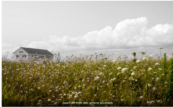
zwart-wit foto met groene accenten