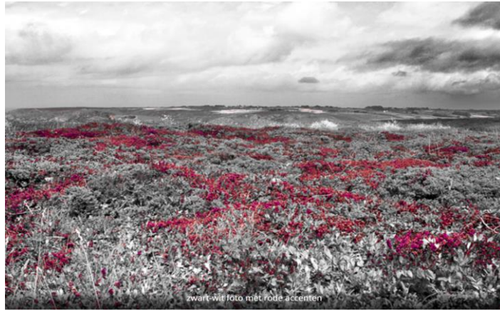
zwart-wit foto met rode accenten